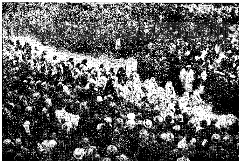
Defilarea grupului de femei din Iacu și jur la marea intrunire din 22 Noiembrie