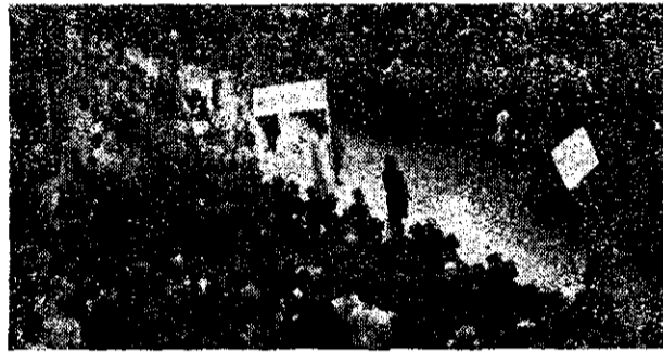
Poporul defilează în fața șefilor.