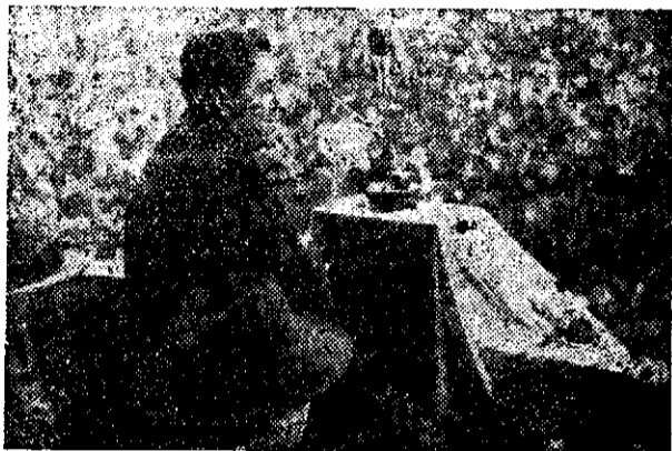
D. ION MIHALACHE vorbește mulțimii de țărani

„D-voastră i-ați unit pe țărani români cu țărani unguri împotriva grofflor. Invațâ-ne și pe noi ce trebuie