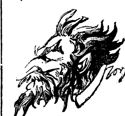
D. VINTILA BRATIANU

In aceeași chestie oficioso par'itudinii populului are o scurtă notiță cu următorul sfârșit: