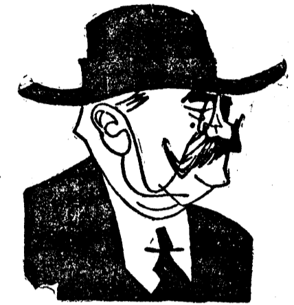
D. VAIDA VOEVOD

blat în persoana președintelui «Astrei». «Serbările Unirii în ziua de 1 Decembrie 1928 trebuie să fie prezidate de un guvern eșit din voiața liber exprimată a națiunii, guvern care va avea datoria să pregătească astfel comemorarea unui deceniu dela Unire, ca să se manifeste în mod unanim gândurile reprezentând unitatea sufletească, una și ne despărțită, ale întreg poporului român.