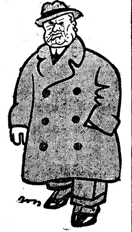
D. C. ARGETOIANU

următoarea notă în această privință: «Așa cum era de așteptat, propunerea românească a fost categoric respinsă. «Aceasta dovedește odată mai mult că Ungaria nu caută în mod sincer să tranșeze chestiunea optanților pe calea negociațiilor directe, și că schimbul de note