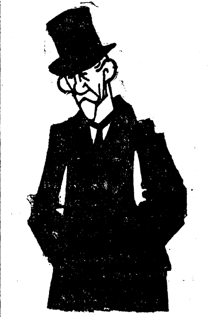
D. GEN. AVERESCU

lichidarea nu e depărtată. D-nii I. Petrovici și M. Manoiilescu împreună cu importantul lor grup vor trece la național-țărăniști.