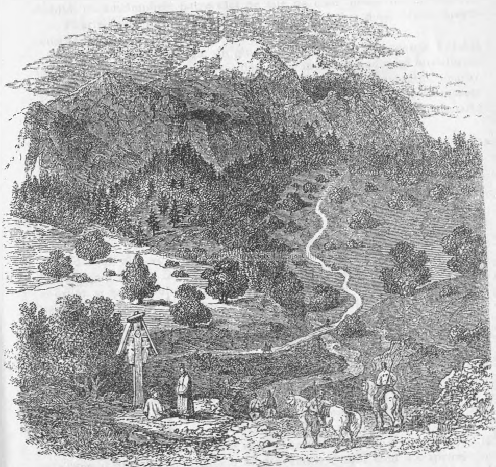
BUCEGIUL (după Doussault).