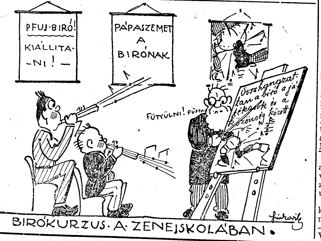
BIRÓKURZUS. A ZENEJSKOLÁBAN.

Wien vasárnapi programja a következő: Amateure—WAC, Slovan—Simmering, Rudolfshügel—Hakoah, FAC—Sportklub, Admira—Rapid, Wacker—Vienna.