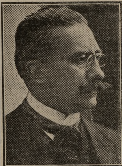
A. Vaida-Voevod Ministru de Interne

Din norocire glontele n'a atins pe nimeni, doar că a spart geamul mașinei. Un funcționar de poliție cu numele Paximade, ce tocmai trecea pe aci a pus mâna pe criminal și l-a adus la minister unde dl Milozi secre-