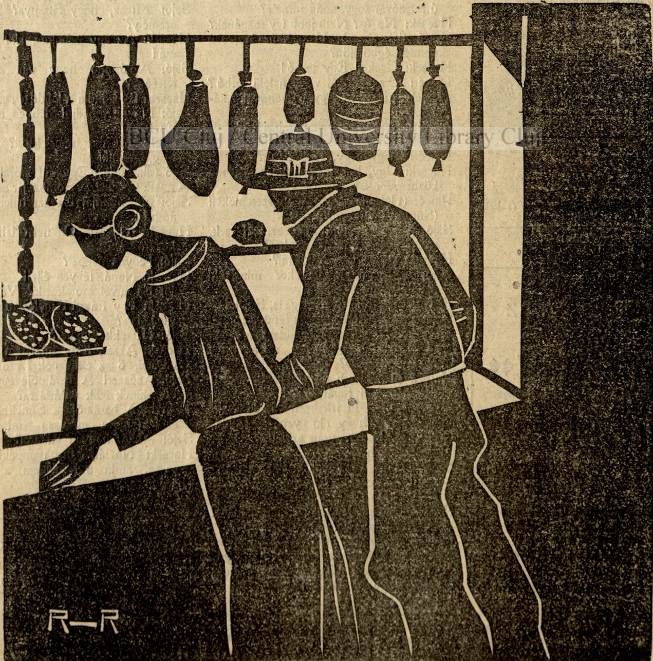
Reschner linorajza és metszete