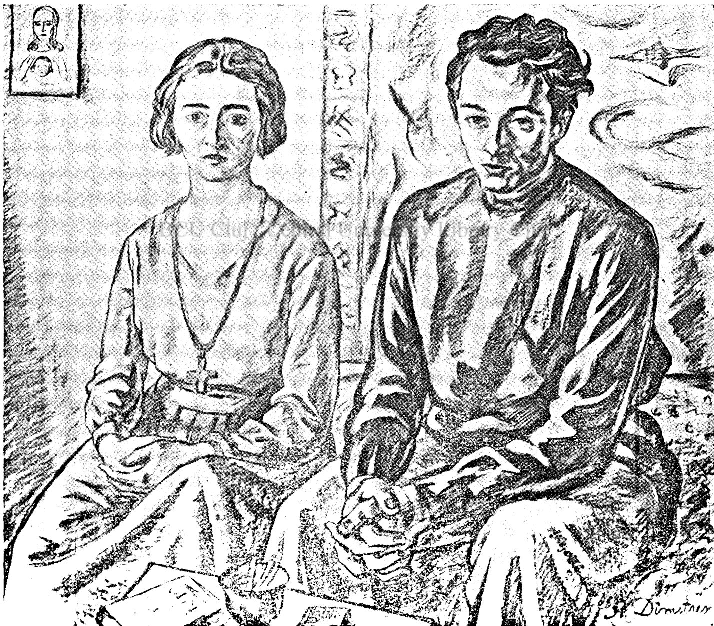
Romancierul Ionel Teodoreanu