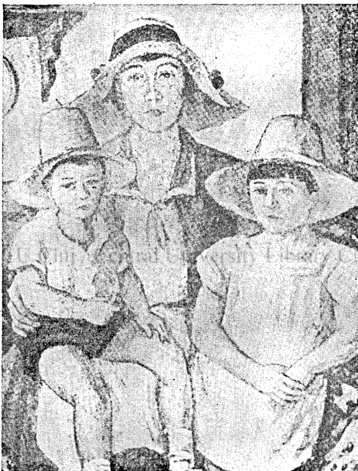
Mama și Copiii

— Mânca-l-ar tata să-l mănânce! Dă să-l văd cu cine seamănă?