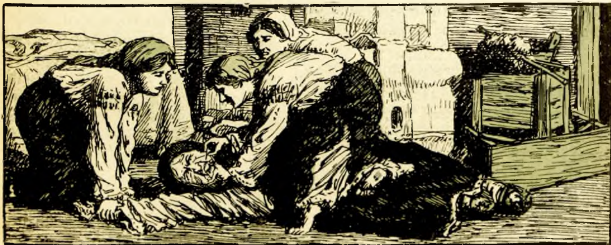
Apoi îi scoate limba afară, i-o străpunge cu acul...

— Atunci voi să vă faceți moarte 'n păpușoi, să nu spuneți nici laie nici bălaie. Oiu vorbi eu și cu dâșii, și las' dacă va fi ceva.