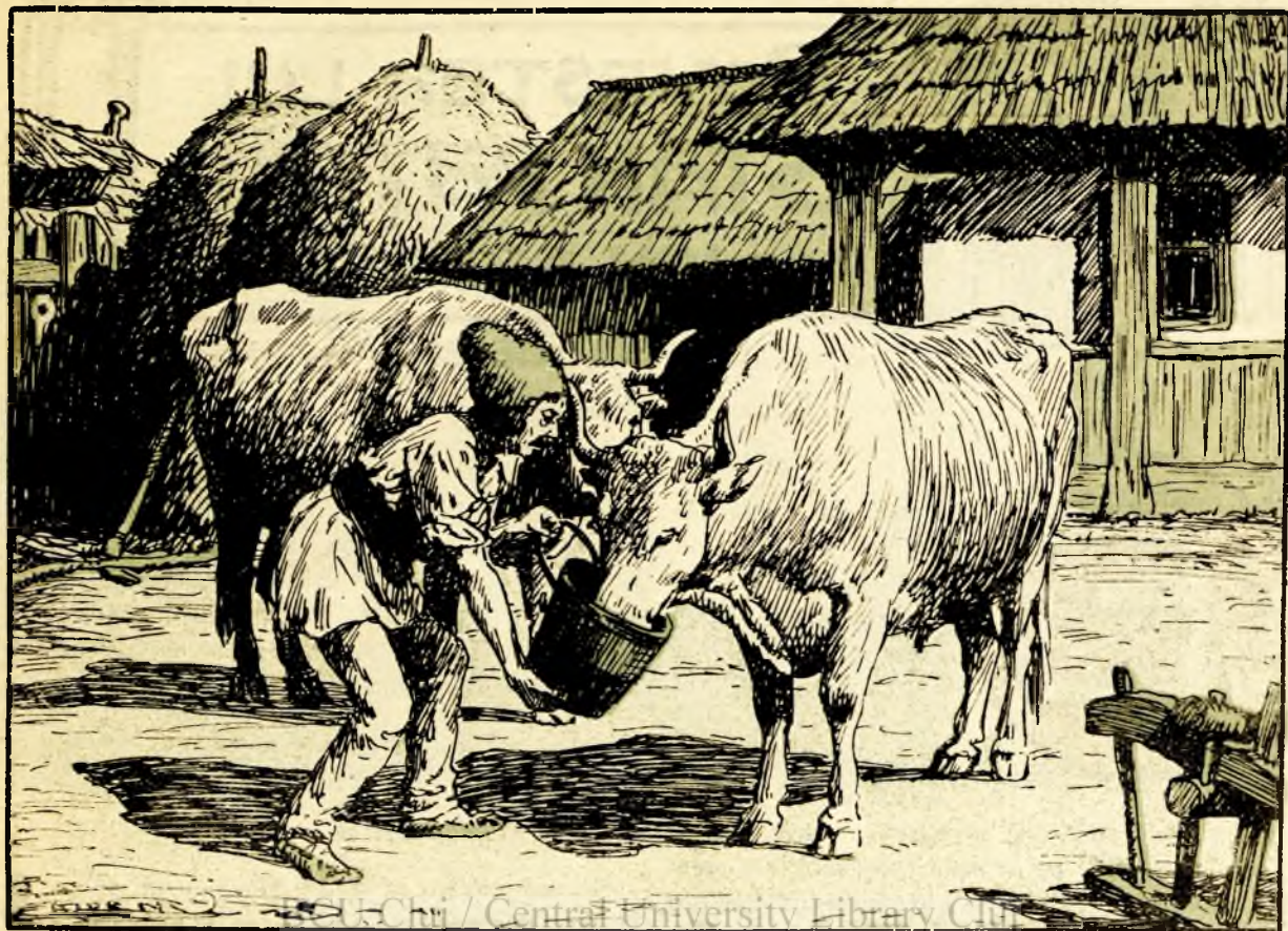
Intr'una din zile, flăcăul înjugă boii la car și se duce la pădure