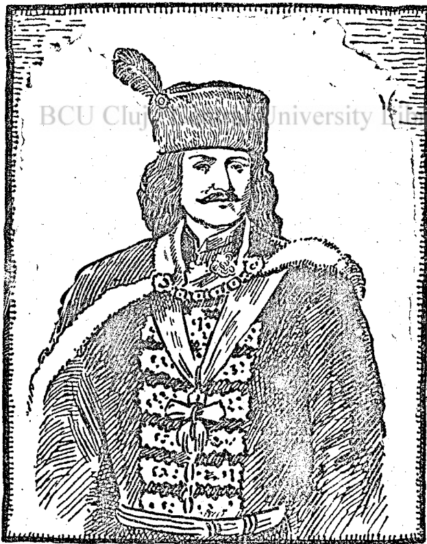
II. Rákóczi Ferenc.

jához, II. Rákóczi Györgyhöz, ki a szászfenesi uton áldozta életét Erdélyért; anyai nagyapjához, Zrinyi Péterhez, kinek feje a bécsujhelyi börtön verpadán hullott porba, atyjához, I. Rákóczi Ferenchez, kit csak a véletlen szabadított meg a hóhér pallósától, — és követte nevelőapja, az első kuruc fejedelem, a Thököly Imre férfias példáját — végül együtt akart lenni legalább a száműzetés lelki közösségében édesanyjával, a legnagyobb magyar aszszonnyal, Zrinyi Il-