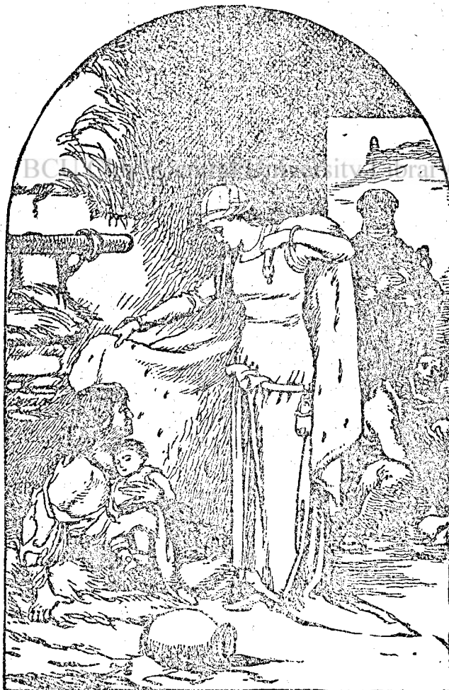
Árpádházi Szent Erzsébet.

Árpádházi Szent Erzsébet, emlékezünk meg mi is halálának hétszáz éves fordulóján minderről a sok jóról, amit műveltél. Csekély szeretettel tanítványaidd lenni amikor hétszáz esztendő ingeridejéből példát és oktat, mit kell tennünk, hogy Krisztus Urunk éi. testet öltsenek. A te lelked megtette Krisztus urunk tanítását, hogy „amennyiben megcselekedtéték egyel a jót az én egkisebb atyámai közül, én velem cselekedtéték meg.” Aldott a Te emléked, add ujítsuk föl a magunk épülésére.