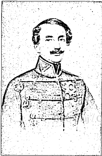
Kiss Ernő honvédtábornok.

Azon családok közül, melyek a Magyarországra telepedett örménységnek a magyar nemzet kebelében örök időkre nemcsak elismert, de előkelő helyet vívtak ki és biztosítottak, az elsők közé tartozik az elleméri és ittebei Kiss család. Tegyük azonban hozzá mindjárt: ez a család — miután mesés szerencsével rövid idő alatt óriási vagyonra és tekintélyre tett szert — helyzetének roppant előnyeit szintoly rövid idő alatt ismét áldozatul hozta nemzeti küldetésének. A Kissek tiszteletet