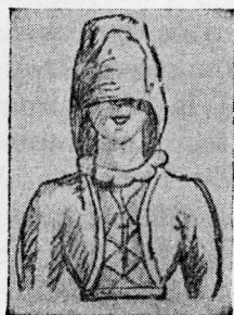
Mireasă evreică cu văl.

După aceea sunt duși împreună la casa miresei, unde îi găsirăm șezând, tăcuți, în capul mesei. Mireasa avea fața voalată până aproape de gură cu o batistă, pe care o poartă în tot timpul ceremoniei. Rochia ei, ca și a celor mai multe dintre tovarășele ei, erau albe de tot.