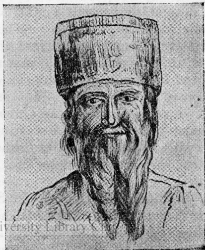
Evreu cu căciulă.