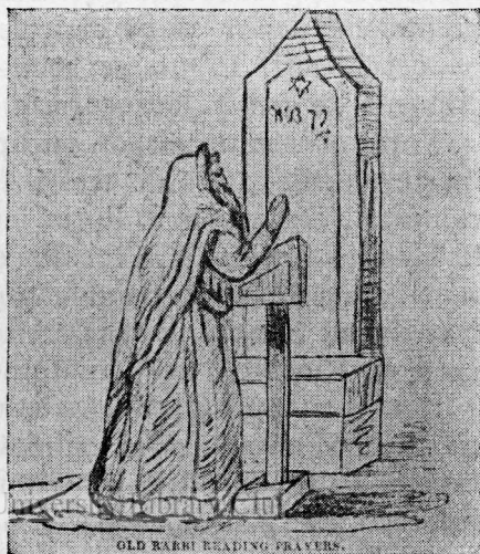
Rabin în rugăciune.

În oraș — spun călătorii — sunt vreo 200 sinagoge, din care vreo 30 mai mari. Numai într'o singură stradă sunt 20. Unele din ele erau pictate cu scene reprezentând Paradisul și Facerea Lumii. În mai multe părți văzură, la intrarea în oraș, eruv-ul, adică o frânghie întinsă dela o casă la alta, peste stradă, închipuind zidul orașului. Le fu imposibil să constate cu siguranță numărul Evreilor. Consulul britanic aprecia populația orașului la 50.000, iar pe Evrei la jumătate, poate vreo 20.000. Evreii înșiși socotesc vreo 5500 familii. Cea mai mare cifră dată de Evrei fu 10.000 familii, iar cea mai mică 3500 familii, adică vreo 15.000 suflete.