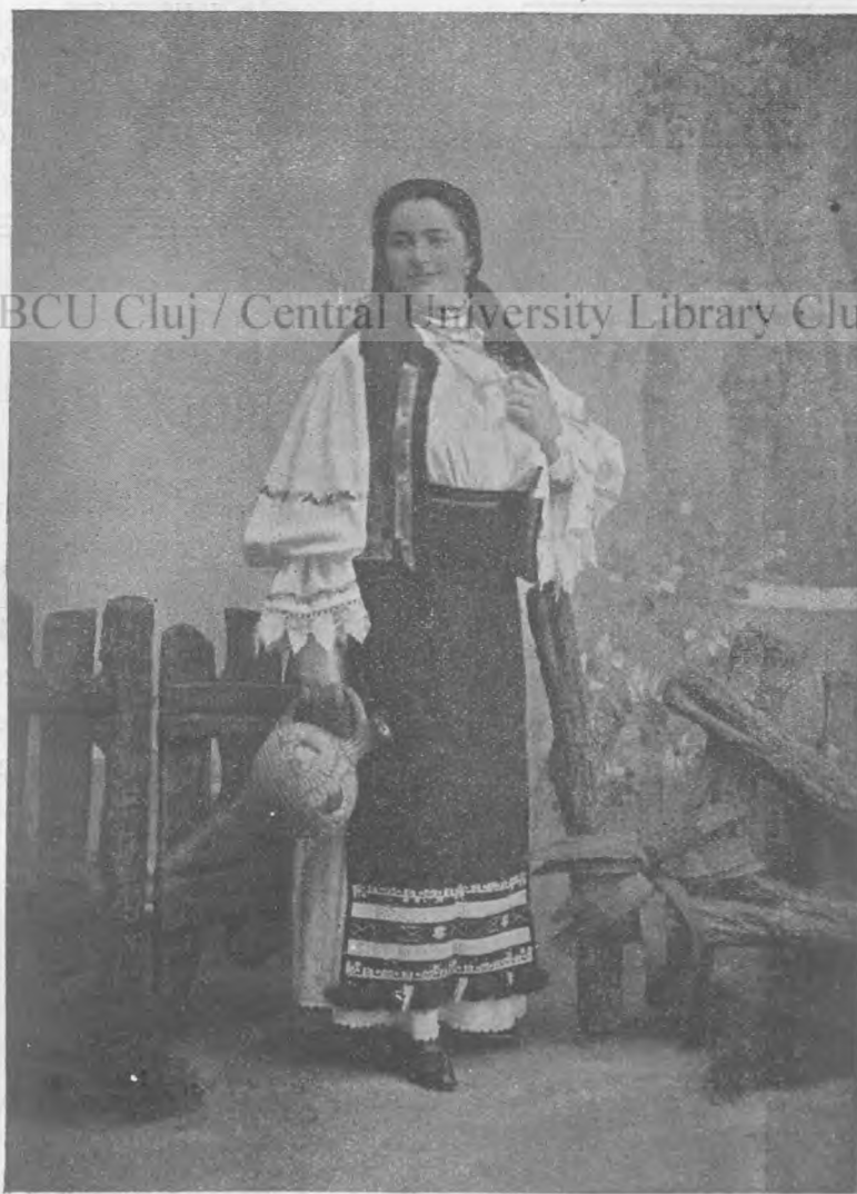
Româncă din Bistriță.