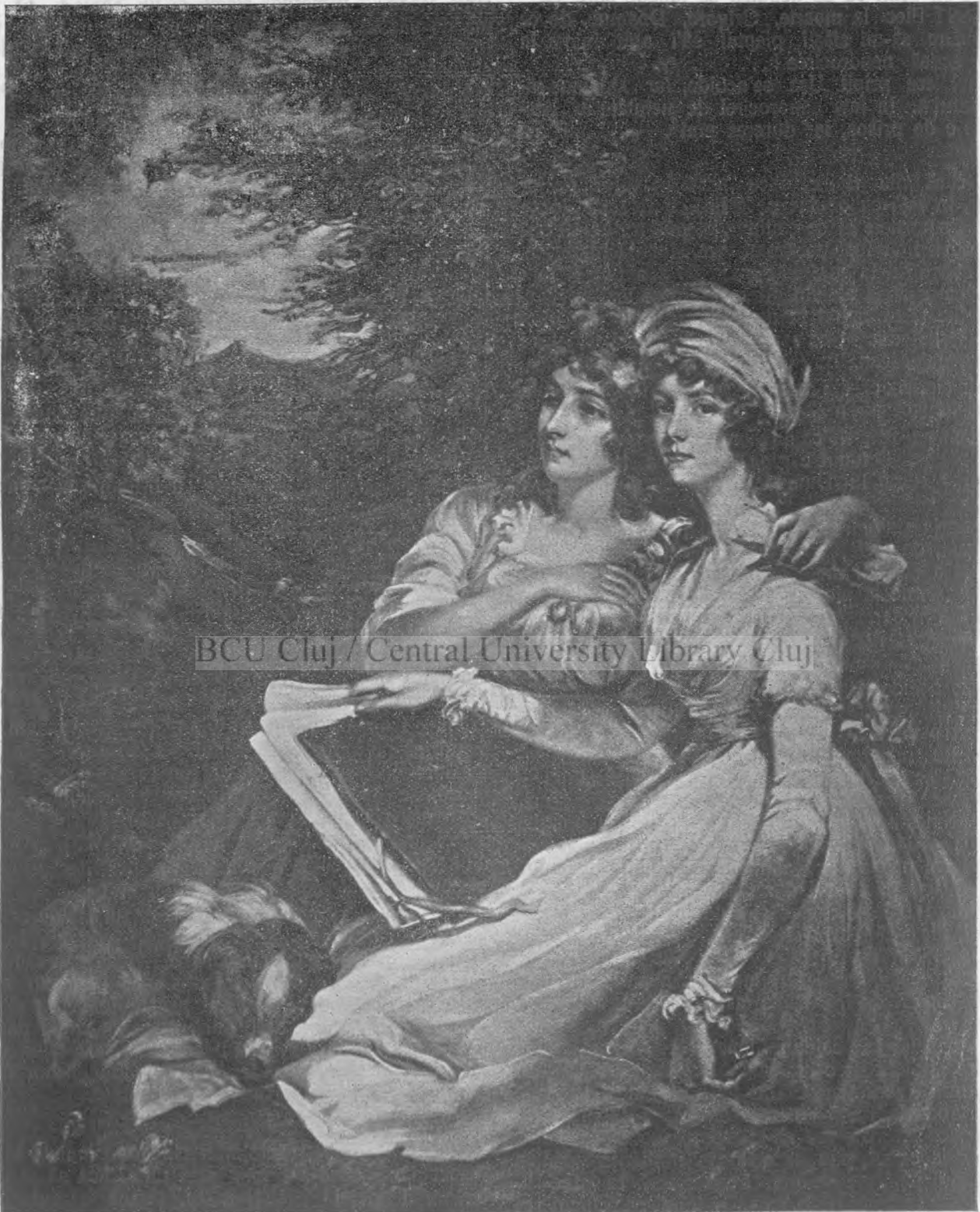
Hoppner : Surorile.