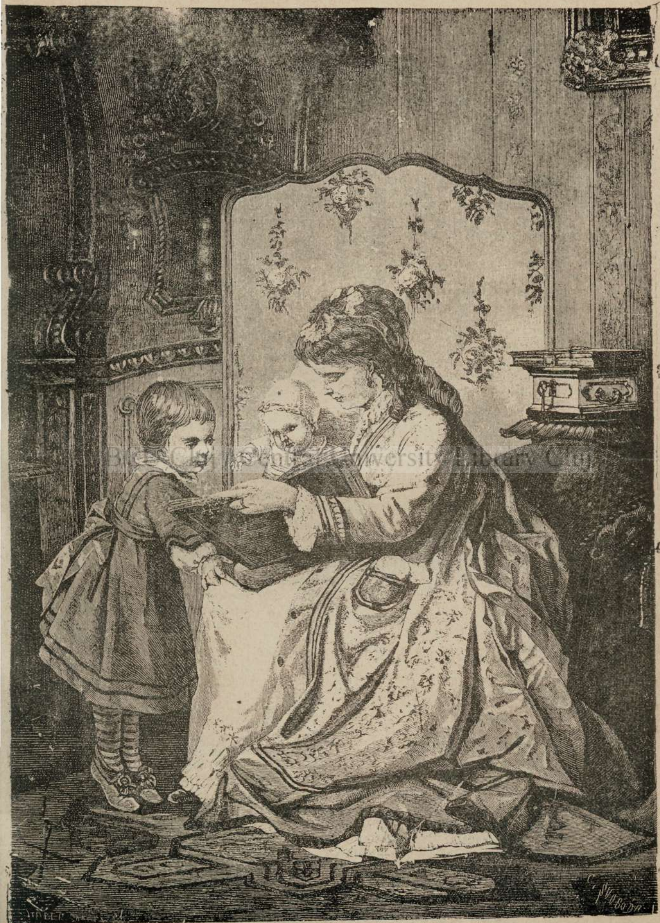
Inc'-o icóna frumósa... mai un'a... si inca un'a....