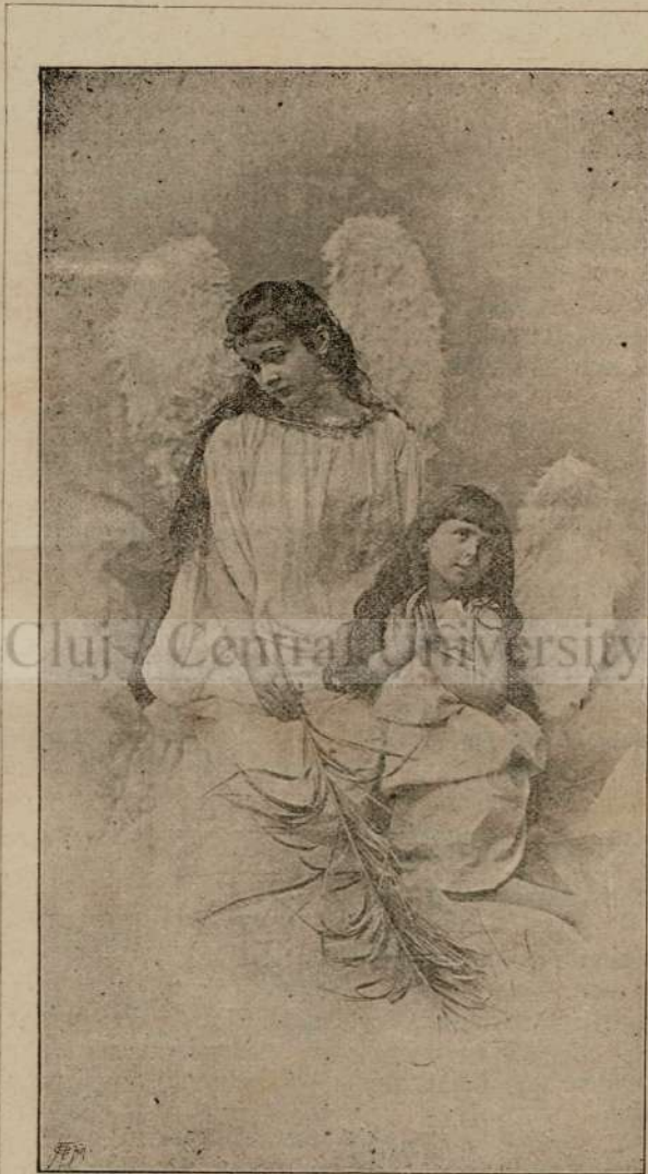
Susu in raiulu fericiniloru.