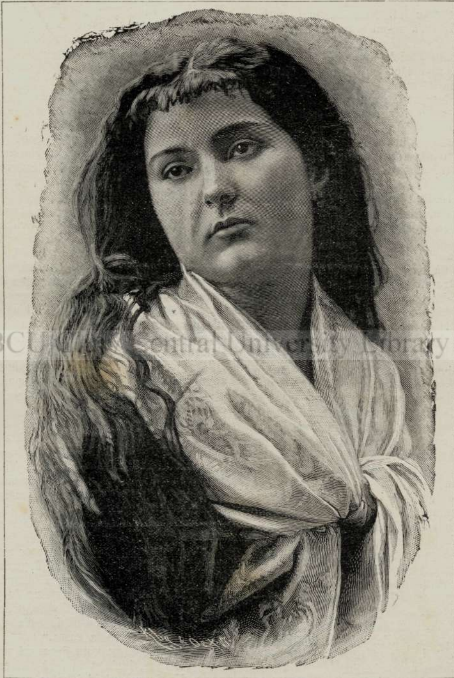
IN DULCE REVERIE.