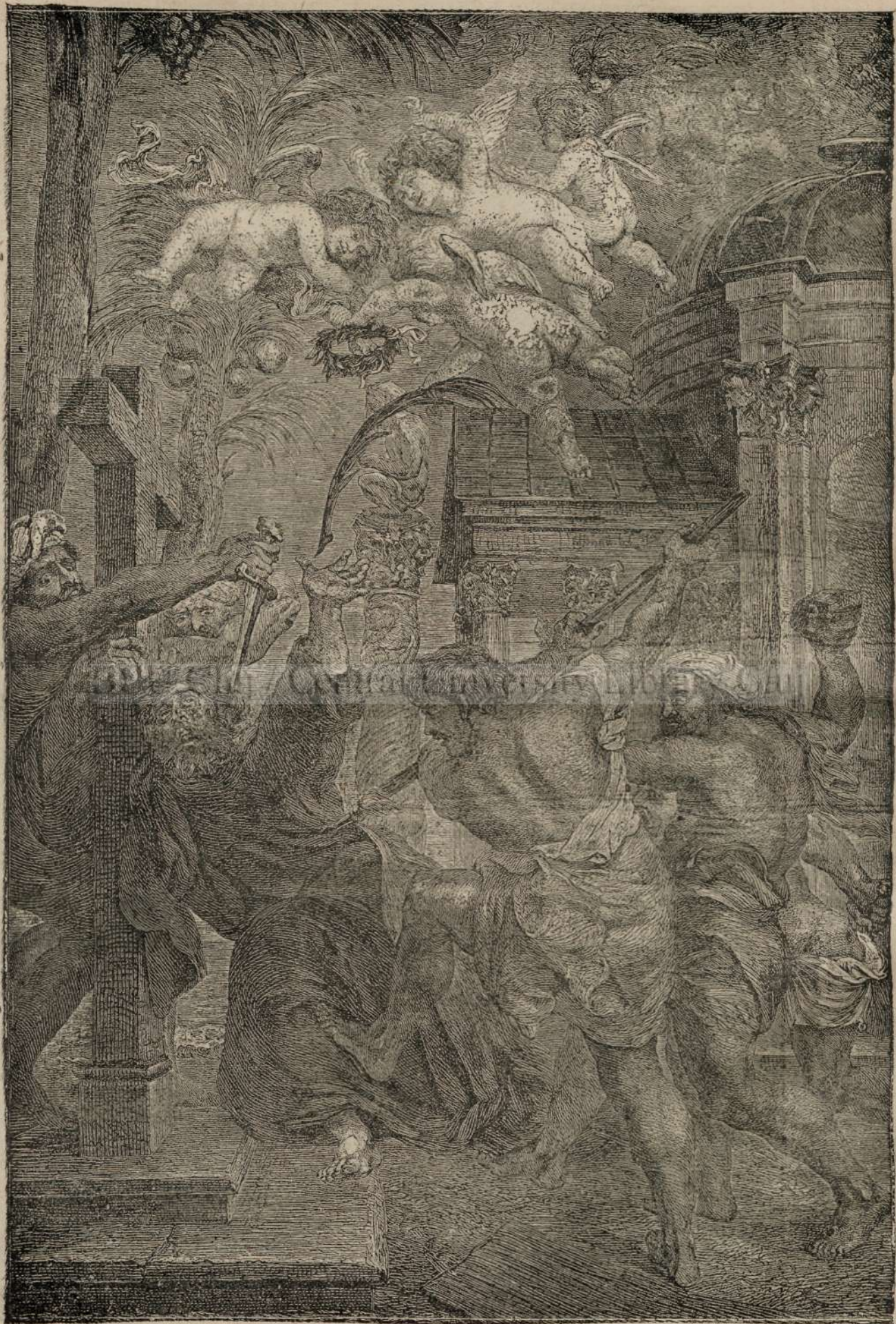
UCIDERA SANTULUI TOM'A.