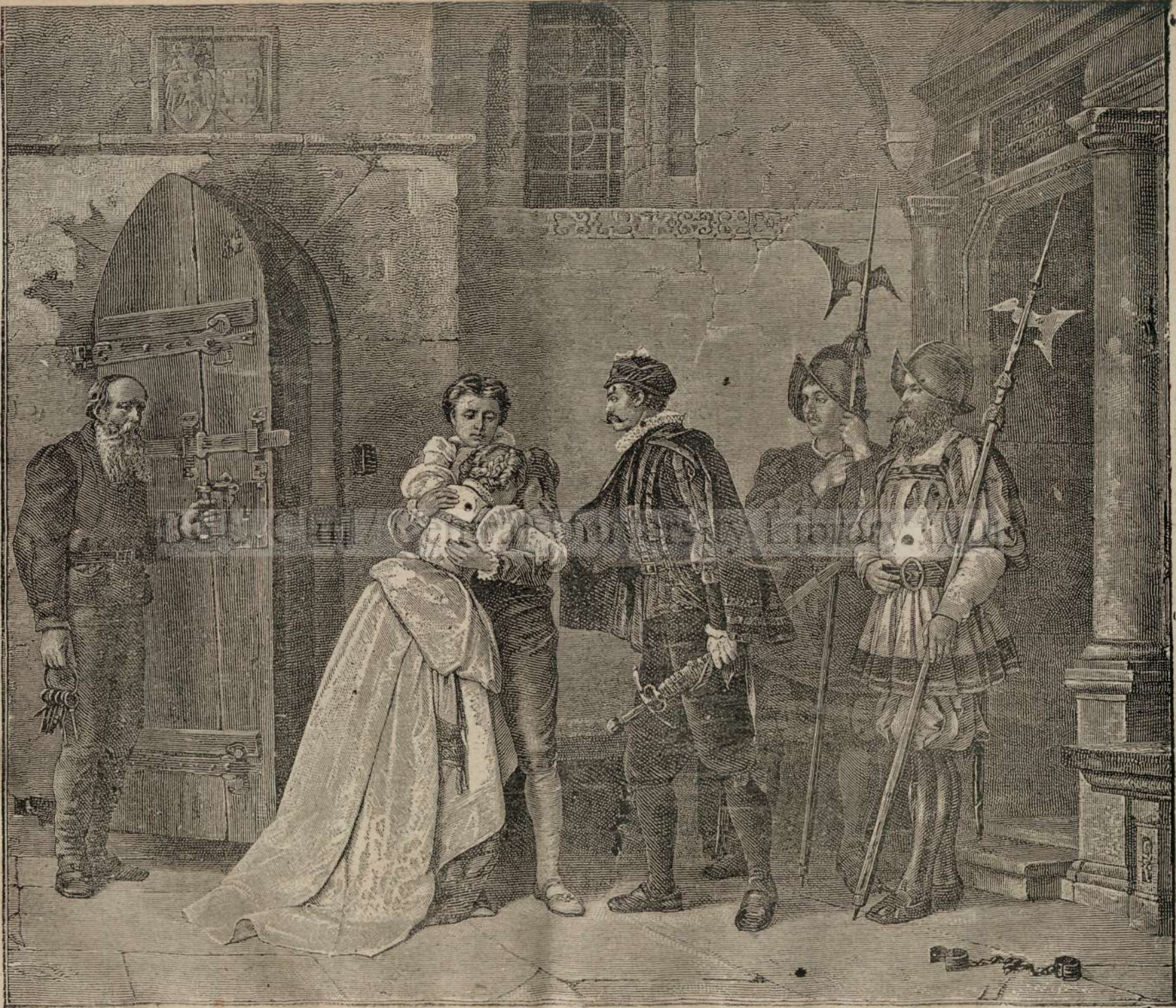
LA USI'A INCHISORII.