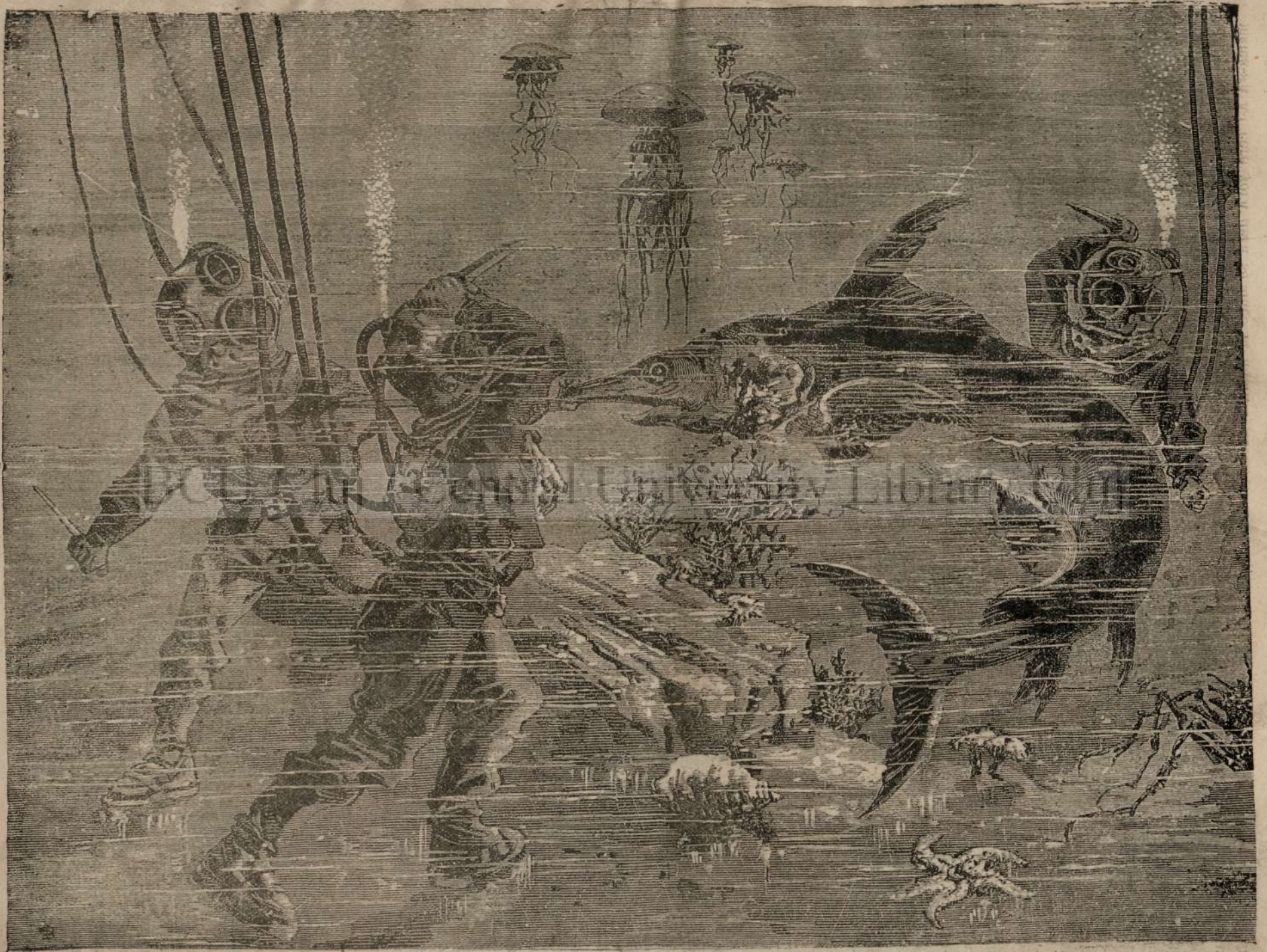
IN FUNDULU MAREI.