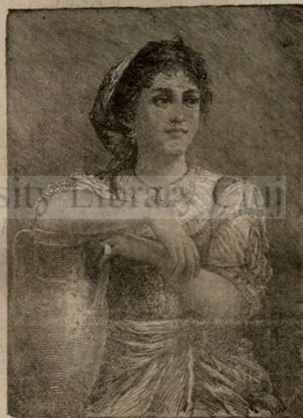
FÊT'A DIN INSUL'A CORFU.