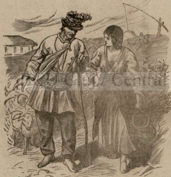
PASTORIULU SI IUBIT'A LUI.