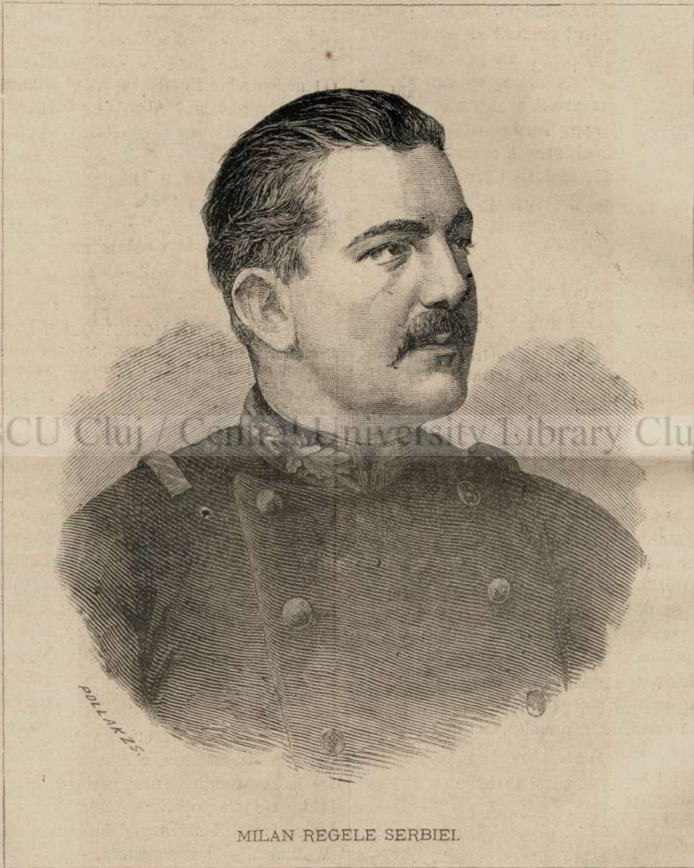
MILAN REGELE SERBIEI.

unu bancheru etc. Fetei asemenea i-se punu obiecte convenabile sexului seu: ace, furca, cărti, condeie, flori, fôr-feci etc. Dupa alegerea obiectului nasiulu ori nasi'a î-i frânge turt'a in capu, dà din ea tuturoru celoru presentii si presentéza cev'a copilului. Fie la tíera fie, la orasiu, fie pan-d'Espan fie azma aceea ce se frânge copilului in