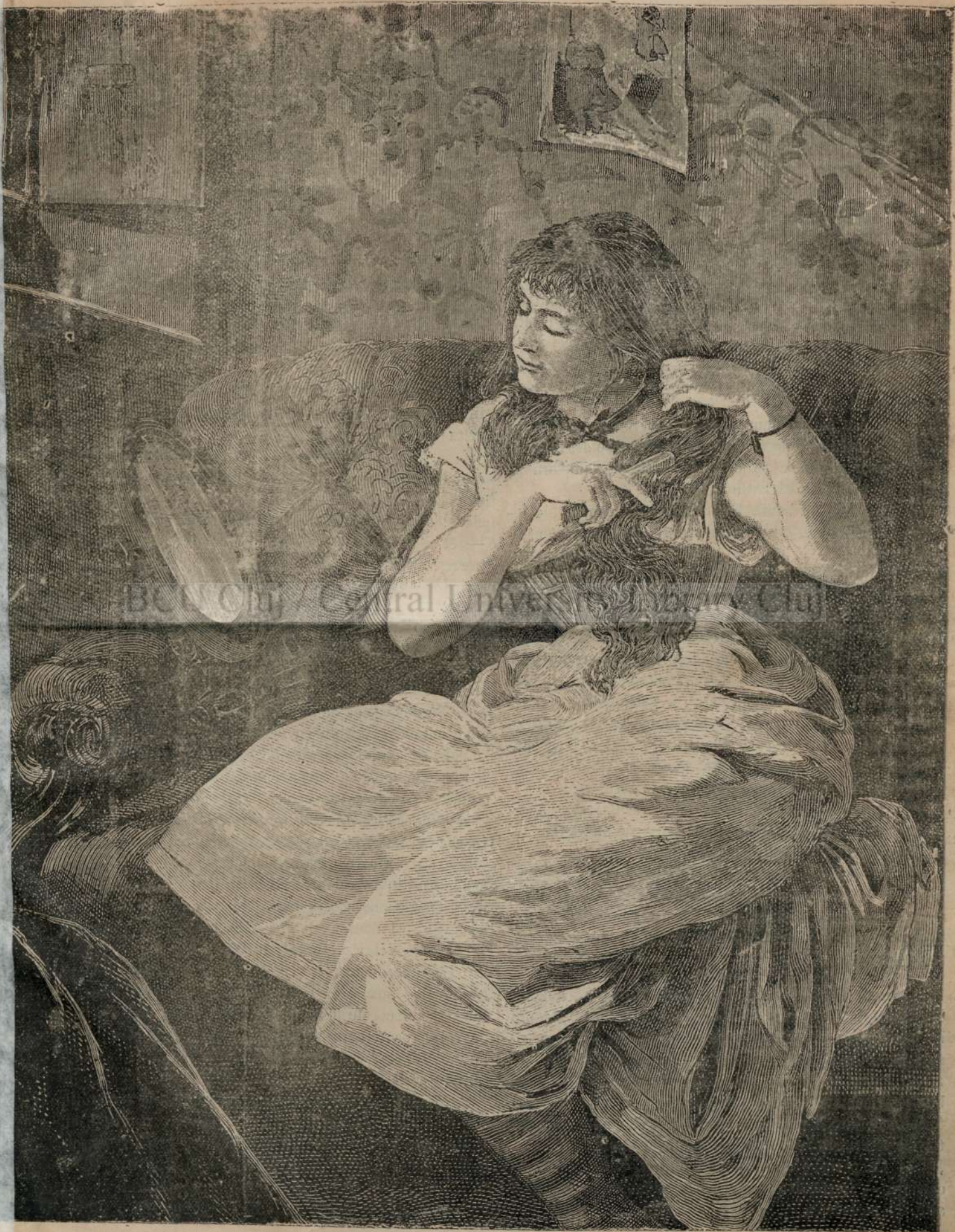
Cucón'a 'si face toalett'a.