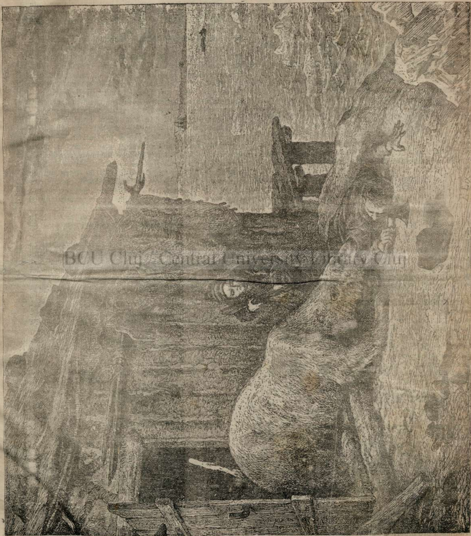
Lupt'a cu ursulu maritanu.