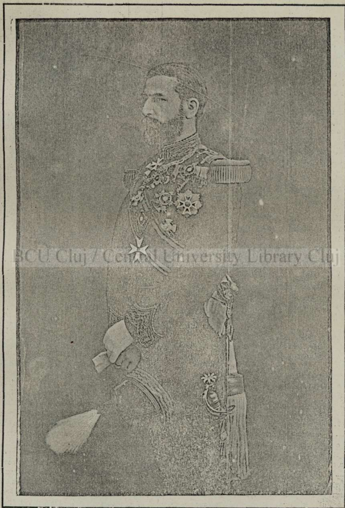
CAROLU I. ANTAIULU REGE ALU ROMANIEI. (Copia de pe premiulu diuariului nostru)