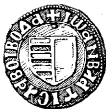
Vladislav I Basarab

Dacă ținem seamă cum este format acest blazon, constatăm că are foarte mare asemănare cu al regilor angevini, cari au domnit în Ungaria: Carol Robert și Ludovic I. Atât blazonul Basarabilor, cât și al Angevinilor are scutul despicat și un cartier fasciat. Cât pri-