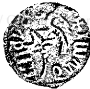
Mircea cel Bătrân Fig. 5