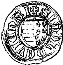
Petru Mușat (mărită) Fig. 7

Iată deci cum blazoanele de pe monetele Domnilor români pot să