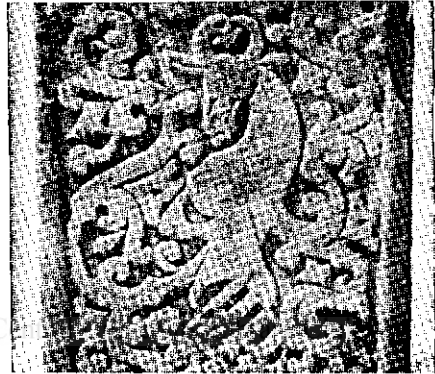
Ștefan cel Mare Fig. 8

ne descopere o serie de amănunte de cea mai mare importanță pentru cunoașterea trecutului țărilor noastre și al familiilor domnitoare. De sigur că cercetări și studii ulterioare vor completa aceste informații și vor aduce contribuții noi la studiul și la cunoașterea amănunțită a istoriei noastre naționale, care pe zi ce trece devine tot mai lămurită.