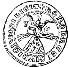
Ludovic I Fig. 6