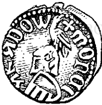
Radu I Basarab Fig. 4

Pentru trecutul familiei Basarabilor această constatare prezintă o importanță excepțională, deoarece ne permite să întrededem vechimea ei seculară și rolul important ce l-a avut atât strămoșii ei, cât și alți