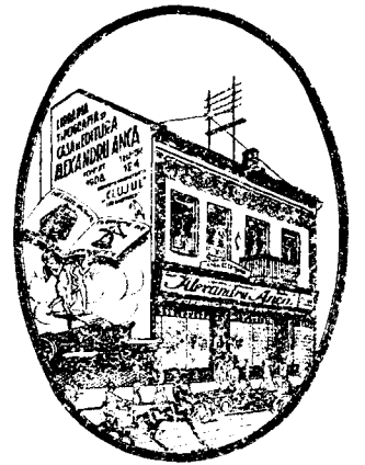
Casa de editură ALEXANDRU ANCA