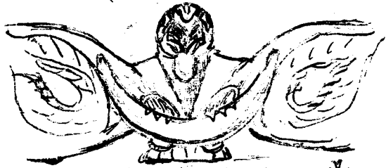
1. Neuzeländischer Fetisch in Berlin (s. Prof. Bastian, Oceanion)