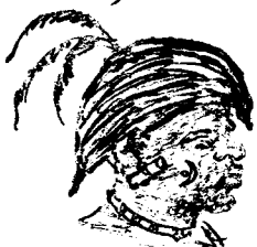
6. Uagogo-krieger (Mission de Mr. G. Revolt)