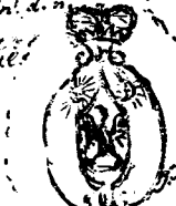
14. Mittelstück von Transylvan. reichs-wapp. Georg Rakoczys (J. Bedus v. J. Wapen u. Siegel Horn. ast. 1838 (pag. 17. v))