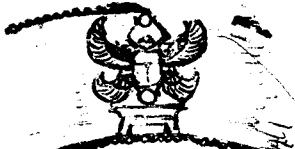
2. Ein Ornament von der ägypt. silberne, 44. in Egypt?