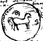
12. Punische Münze, Muscum in Konstantinopel