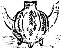
5. Tonkrug aus Thon, 44. v. Schliemann (cf. G. & M. fig. 8 aus Peru?)