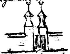
13. Friedhof Sidi Bel Hassan (Siles) in Tunis