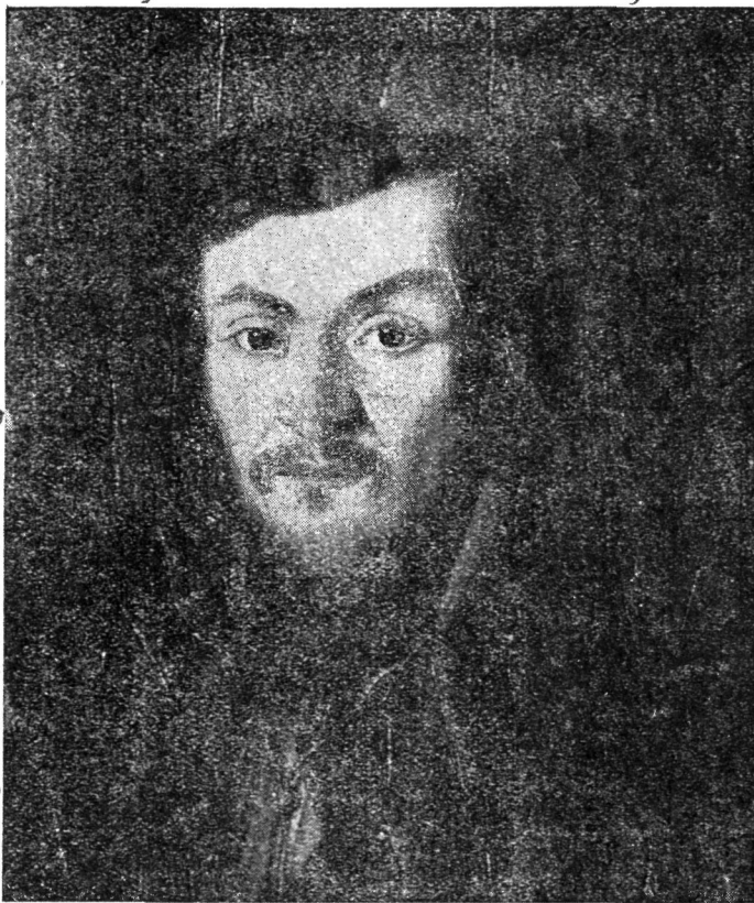
Constantin Dăniel, pictor bănățean (1798—1873) . . . Portret

COPERTA: Portret de bărbat, de pictorul bănățean . . . Constantin Dăniel