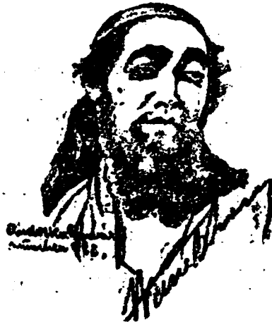
Werner Krauss — Náthán