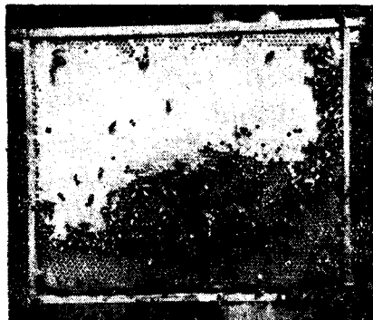
A nagyfelületű NB-lépeken jól telel a család.

Ugyancsak mérlegelési adataink bizonyítják, hogy a szabadban álló köpenyes kaptárakban semmivel kevesebb élelmet fogyasztottak többet, mint a zárt helyiségben. Tehát tapasztalataink szerint felesleges ve-