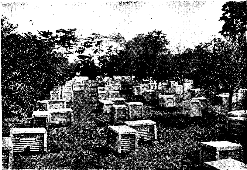
Vándorméheszet Bocsnádi kaptárokban.

sel nyugodtan kivárja az akár hetekig tartó zord időjárás megszűntét és a szép napok beköszöntésével rajként tódul kifelé a megmentett értékes dolgozó méhsereg . Ugyanakkor a többi kaptárból csak nagyon gyéren repülnek, mert a rossz időjárás alatt a családtagok legyengülnek. A zord időben lezárt köpenyes család akácról akkor is adott 30 kg felesleget, amikor más rendszerű kaptárakban lévő, a szeszélyes rossz időben is kirepülő családok csak 5 kg-ot adhattak. E módszer korszakot jelenthet méhészetünkben az akác kihasználását illetően. (A tavaszi szeszélyes időjárásból sajnos Erdélynek is bőven kijut! Szerk.)