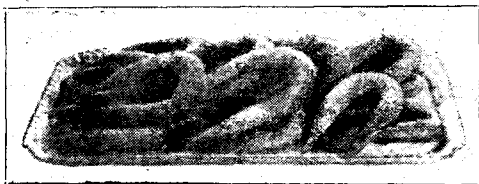
A ceglédi kiflik szendvicses tálon.

Ceglédi kifli. Hozzávalók: 12 evőkanál tej, 12 dkg. élesztő, 5 kockacukor, 2 evőkanál méz, kevés só, 50 dkg. zsír, két egész tojás, 60 dkg. liszt.