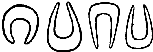
A ceglédi kifli kisodrás formái.

Mielőtt a tészta elkészítéséhez fognánk, két órával előbb áztatjuk be a tejszeletet az élesztőt, mézet, cukrot és a sót s az egészet tegyük langyos helyre s ott kelni hagyjuk. Ha megkelt, a zsírt jól kikeverjük s hozzáadjuk a tojást, a lisztet s a kelt tejet s az egészet jól elkeverjük, majd meglisztezett nyújtótáblára tesszük s kigyúrjuk. 60 kis gombócot készítünk belőle s kelni hagyjuk azokat. Legeélszerűbb, ha este megcsináljuk a gom-