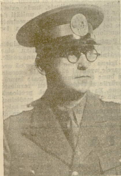
D-1 Prof. CONST. GIURESCU Ministrul Propagandei Naționale

Cu aceste gânduri sunt alături de dv., vă întind o mână leală și vă doresc tuturor deplină reușită. (Aplauze puternice).