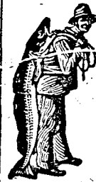
La cumpărarea Emulziei, luați sîmă să aibă marca de scutire alui Scott: Pescarul!

bube, umflături, rane, cari vin din sînge sărac, și nu să vindecă, le vindecă mai bine