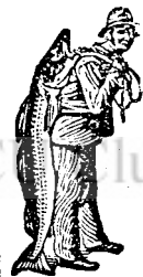
La cumpărarea medicinei Emulsio , vă rugăm să fiți cu atențiune la marca de scutire SCOTT — pescarul.

Dați numai suferitorilor Emulsia lui SCOTT și-i cruțați de nopțile nedurmite. Dinții le cresc fără dureri și morb de intestine, albi, tari și drepți.