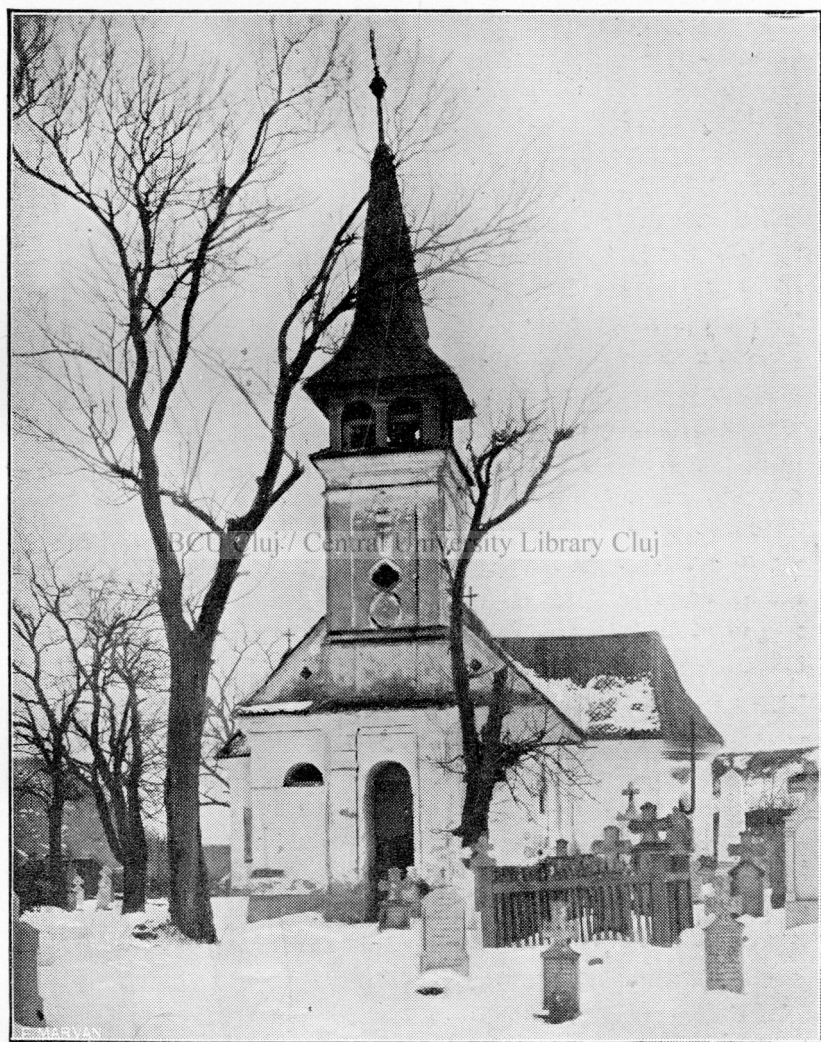
Ctitoria lui Br. Baiul : biserica cea nouă din Zărnești.