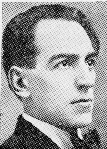
DI DIM. PSATTA