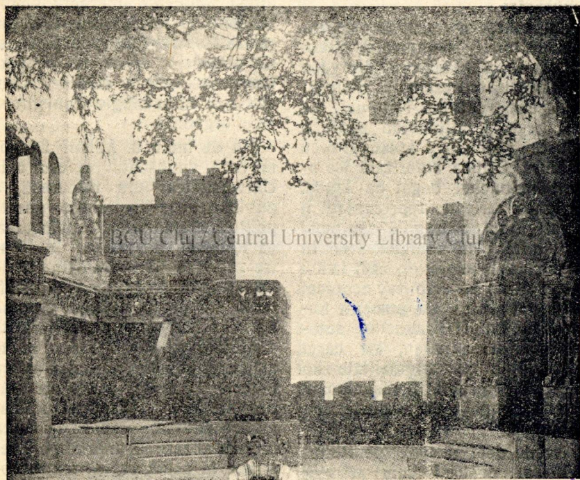
„Lohengrin” de Richard Wagner. — Decorul actului al II-lea.

TEATRUL NAȚIONAL DIN CLUJ: Marți 12 Ianuarie: „Plicul”; Joi 14 Ianuarie: „Controlorul vagoanelor de dormit”; Sâmbătă 16 Ianuarie: „Plicul”; Duminică 17 Ianuarie (seara) „Plicul”; Marți 19 Ianuarie: „Ruy Blas” (premieră).