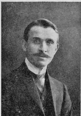
Dr. ONISIFOR GHIBU.

Născut în Săliște (lângă Sibiiu) în 31 Maiu 1883. Liceul l-a făcut în Sibiiu și Brașov. A studiat apoi teologia în Sibiiu, filosofia și pedagogia la universitatea din București, Buda- pesta, Strassburg și Jena. Doctor în filosofie dela Jena. Actualmente referent școlar în Consistorul ar- chidiecezan din Sibiiu și profesor suplinitor la Se- minarul „Andreian“.