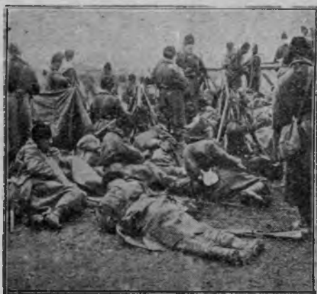
In așteptarea luptelor.

Exploziile obuzelor se succedau cu o iuteală neînchipuită. Proiectilele cădeau cu sutele asupra tranșeelor noastre, svârlind în aer mase mari de pământ. Arborii erau zdrobiți în mii