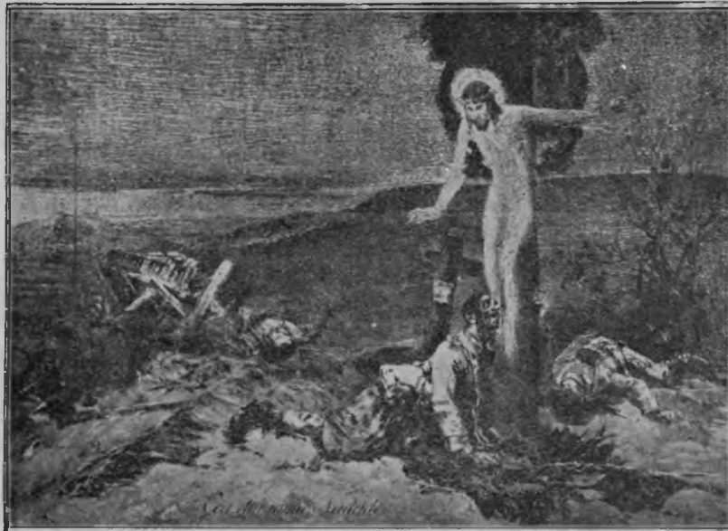
Cea din urmă nădejde.

Tunul crunt, urlă în neagra zare Lung clocot fierbe pe văi puternic