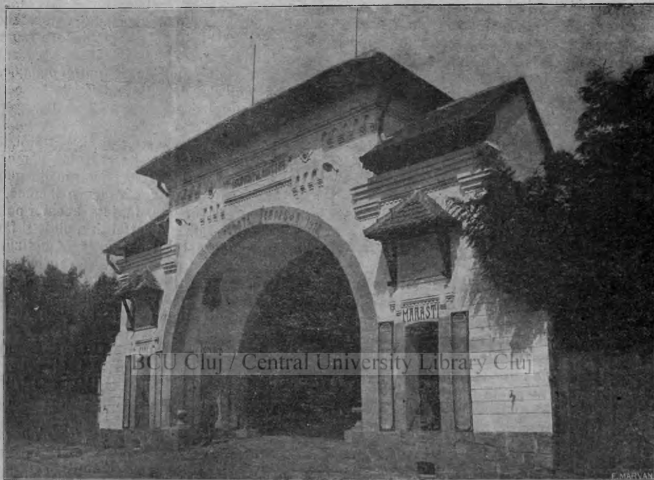
Monumentul Eroilor Argeșeni ridicat în poarta regimentului 4 Argeși Pitești, care a fost inaugurat în ziua de 26 Septembrie 1926.