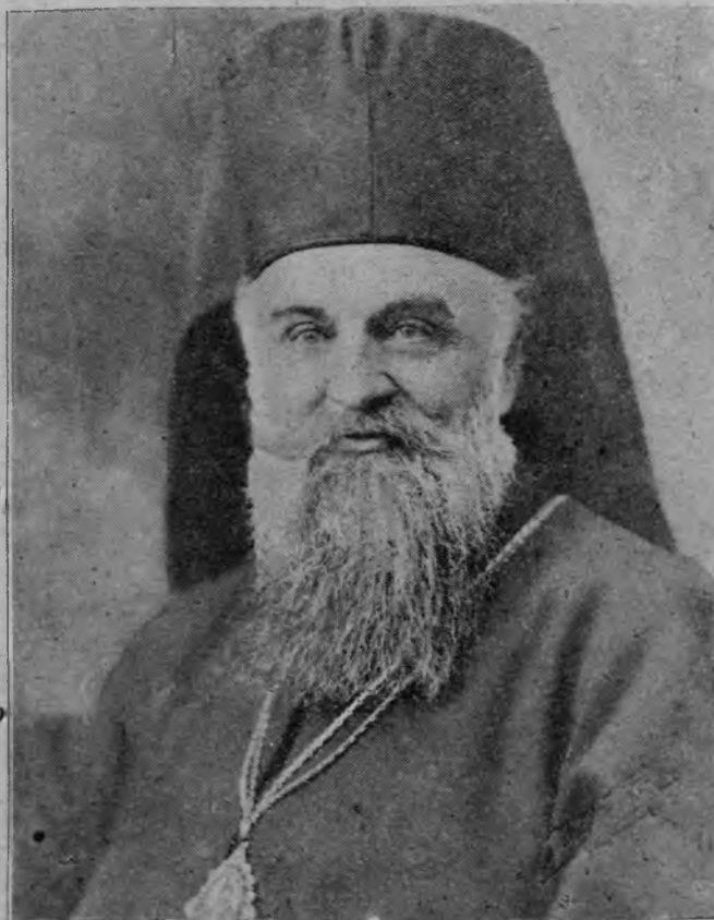
I. P. S. S. Patriarhul României Dr. MIRON CRISTEA Președintele Soc. Mărmăritele Eroilor

Tiptele de o măreție epicoi ale eroilor noștri, cari au contribuit cu suprema jertfă a vieții lor la înfăptuirea celui mai mare eveniment din in- treg trecutul neamului românesc: - trebuie să fie pentru tot Românul în solemn ire- sistibil de a aduce mereu jertfe noi și noi noi și noi pentru binel obște; altcum n-am fi vrednici de ei. -