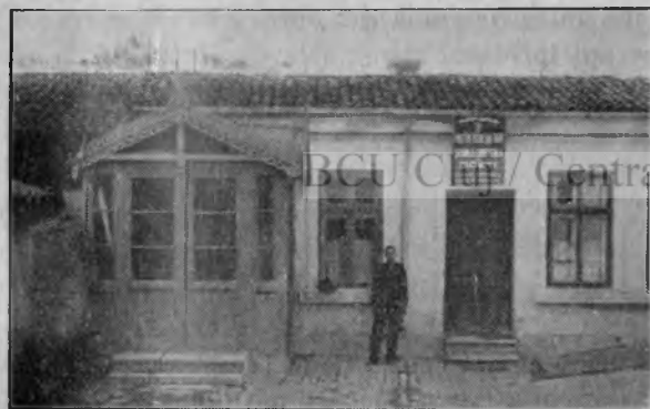
Liceul Comercial de băeți din Silistra (Local închiriat)

Cititorii „României Eroice”, mișcându-se pe acelaș plan de existență spirituală, nu vor trece orbi,