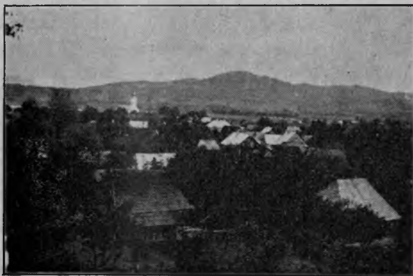
Pe malul Tisei: Com. Bocicoiul Mare, Maramureş. Vedere generală

Dacă ne ridicăm privirile spre el, îl vedem înconjurat de Munţii Carpaţilor mândri, ca un lac visător. Tot astfel au ajuns şi locuitorii.