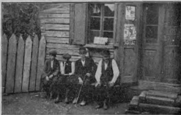
În fața unuia dintre nenumăratele localuri de jaf: Două generații

Am fost unul dintre elevii buni ai profesorilor, Titu Maiorescu, Coco Dimitrescu—Iași, Rădulescu Motru, Nicolae Jorga, ca să-i număr pe cei mai cunoscuți. Pentru ce acești oameni de înaltă valoare, sau alții mulți pe cari i-am avut prin școalele prin cari am trecut, nu au săpat atât de adânc în inima mea, pentru ca să mă determine să am cultul pe care îl păstrez pentru acel modest dascăl de sat, care stă astăzi cu figura lui pământească în fața biuroului meu și pe care, în decursul vieții sale necăjite, în cercul obscur unde funcționa, prea puțini dintre stăpânitorii zilei, l-au putut înțelege și aprecia.