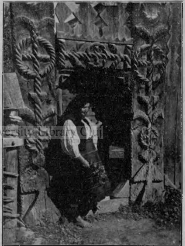
Moştenirea trecutului: Poartă din Maramureş

„Apoi, domnule, noi, nici atunci n'am fost proşti, şi nici acuma nu ne ținem mai sus”.