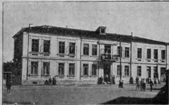
Liceul bulgar de băeți din Silistra

La Silistra funcționează un Liceu Bulgar de Băeți și un Liceu de Fete. Liceul de Fete a funcționat până acum într'o clădire veche, cu nouă săli de clasă, laboratorii, cancelarii, etc., clădire mare, încăpătoare, care putea foarte bine să servească scopului ei. Bulgarii însă au clădit, pentru creșterea fetelor