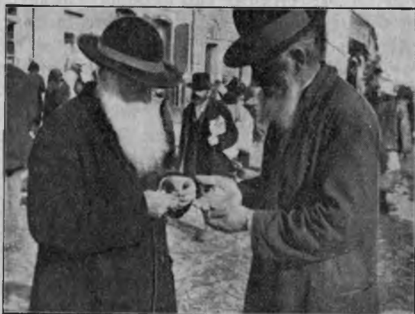
Nouii stăpâni ai Maramureșului

Exemplele de felul acesta le găsim pretutindeni, dela hotare la hotare. Din pildele acestea, din aceste aspecte hidoase, se vede în mod palpabil cum conducătorii putregăesc viața satelor, după ce au cangrenat toate resorturile vieții publice. — Nu mă pot reține de a menționa jalea care m'a cuprins cercetând un sat mai răsărit, locul de origină al unui fost înalt demnitar al statului. Șuvoaiele curg prin stradele principale ale comunei, le sapă și transportă podurile