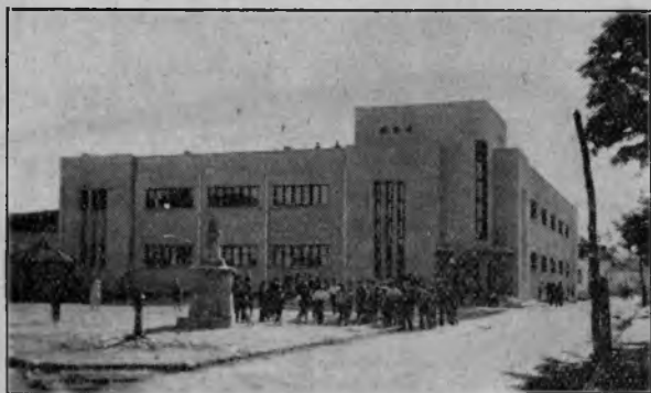
Iredentismul în funcțiune: Noul Liceu de fete bulgar din Silistra

Nu va fi de mirare, dacă ne vom trezi mâine cu un nou palat somptuos bulgăresc, dacă se va