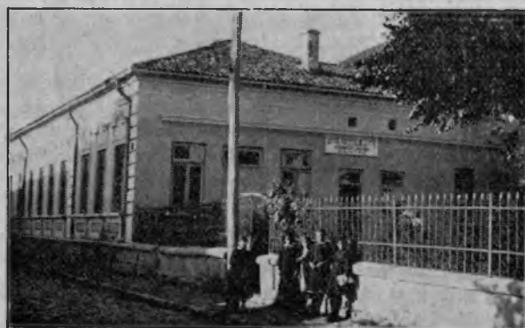
Vechea clădire a Liceului de fete bulgar din Silistra

Dăm în clișeu clădirea în care a funcționat până la 1937 Liceul Comercial de Băeți. Se poate vedea în ce clădire mizerabilă se adăposteau nouile