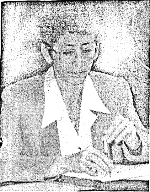
urmare din pagina 1

Ei au criticat faptul că în fiecare an veniturile lor au scăzut, iar activitatea pe care o desfășoară este puțin apreciată de autoritățile sanitare. În cazul în care vor fi închise cabinetele medicilor de familie, activitatea din sectorul sanitar va fi blocată, au mai apreciat protestatarii.