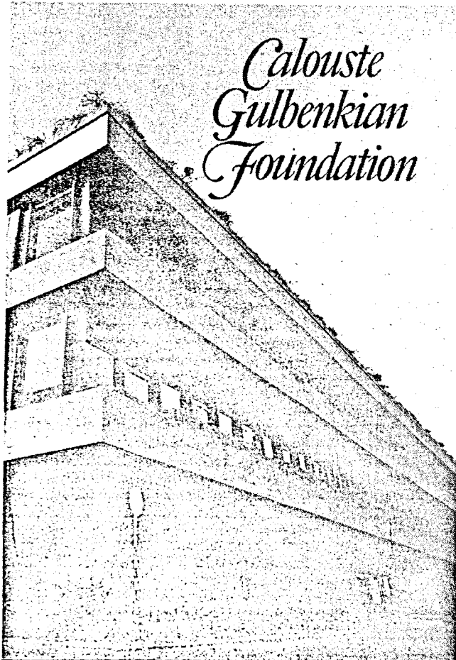
Calouste Gulbenkian Foundation

Britanie. Dotat cu o excepțională intuiție financiară, pe fondul unei temeinice pregătiri și al unui imens noroc, el a simțit viitorul petrolului din Orientul Mijlociu. Deși foarte tânăr, a fost animatorul organizării extracției și comercializării lui multinaționale, de pe urma căreia a avut mulți ani un comision de 5%. Acesta i-a adus o avere fabuloasă și numele de „Domnul Cinci Procente”.