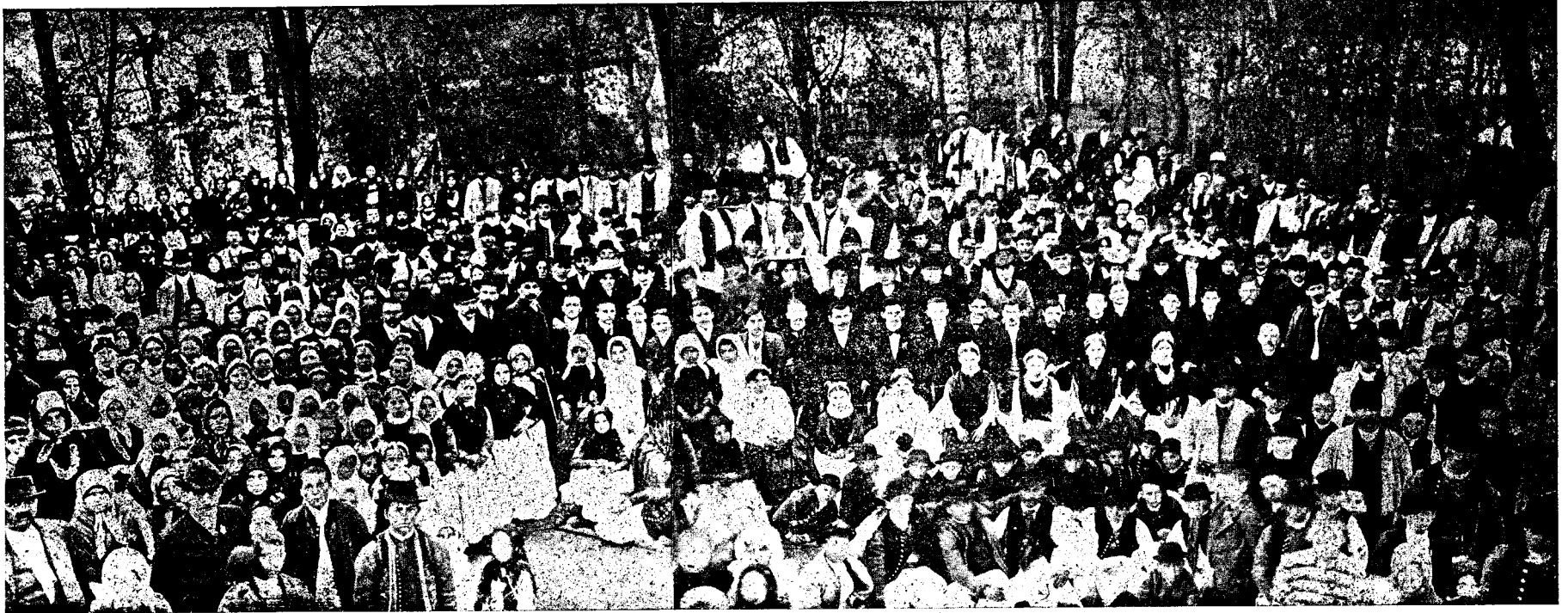
O adunare de domni și țerani români în Ghioroc, lângă Arad.