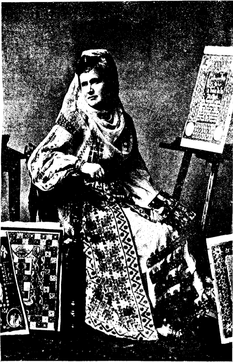
Regina României, poeta Carmen Sylva.

— Lucrând, în costum național românesc la scrierea și zugrăvirea unei sfinte Evanghelii. —