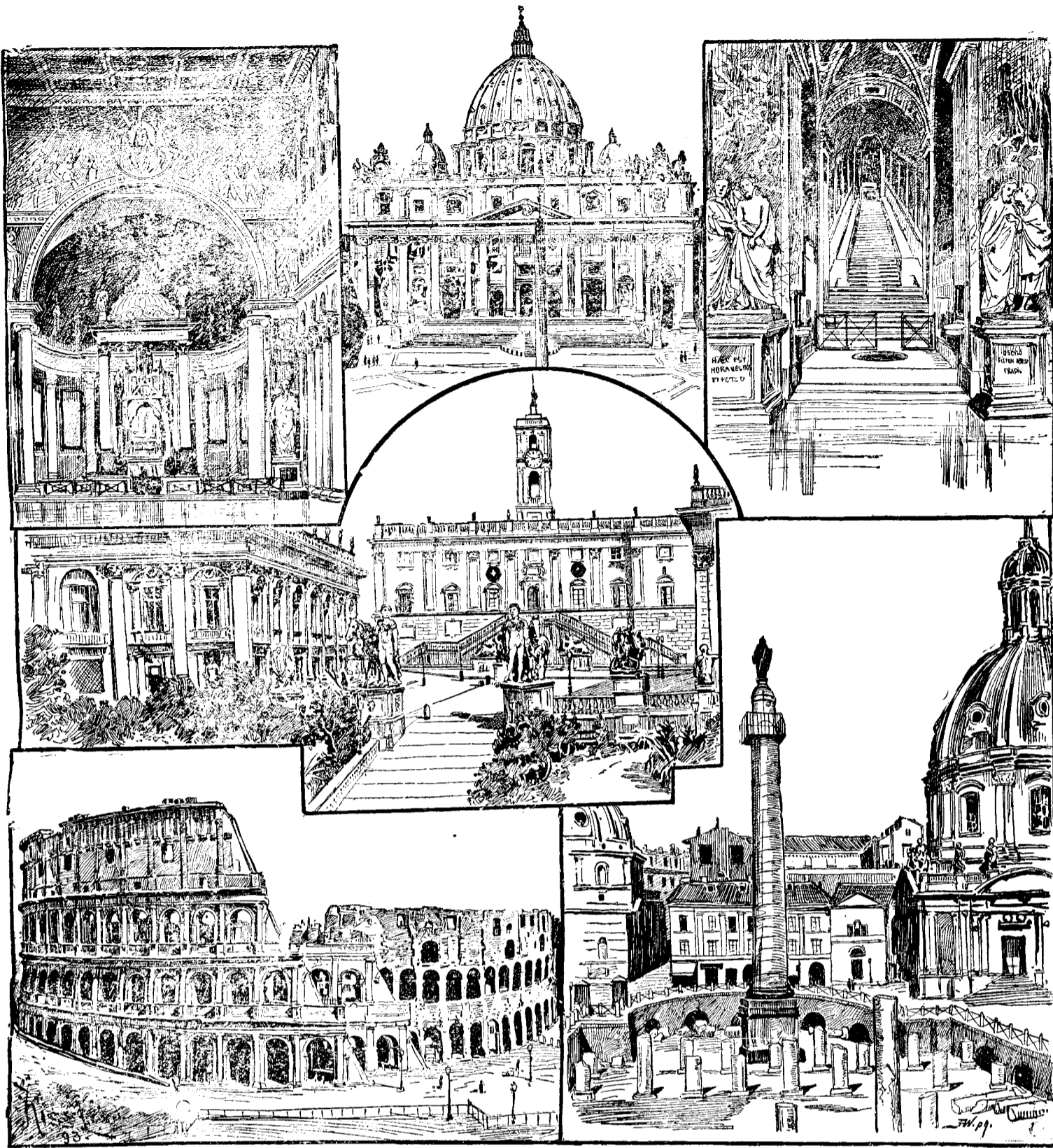
Biserica sfântului Petru. (La dreapta și la stânga părți din lăuntru ei.)