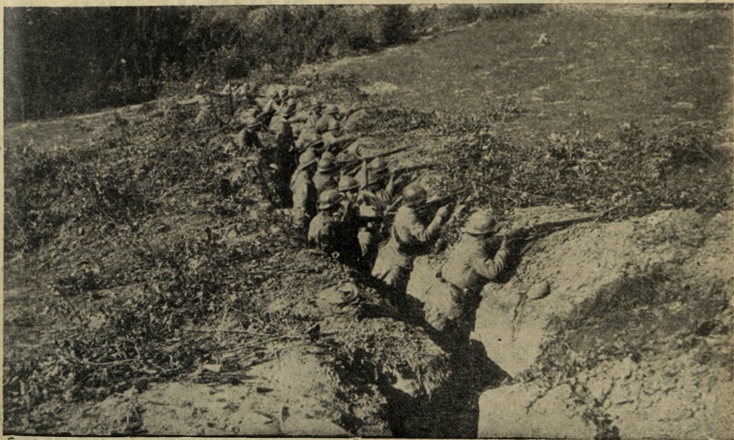
Trupe din Regimentul 35 Infanterie în tranșee în anul 1917