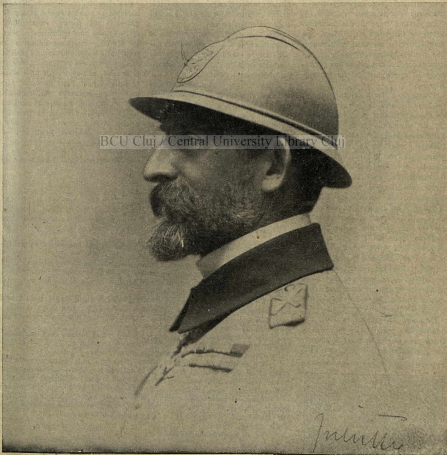
REGELE FERDINAND I.

Redacția și Administrația BUCUREȘTI I Strada Edgar Quinet Nr. 6