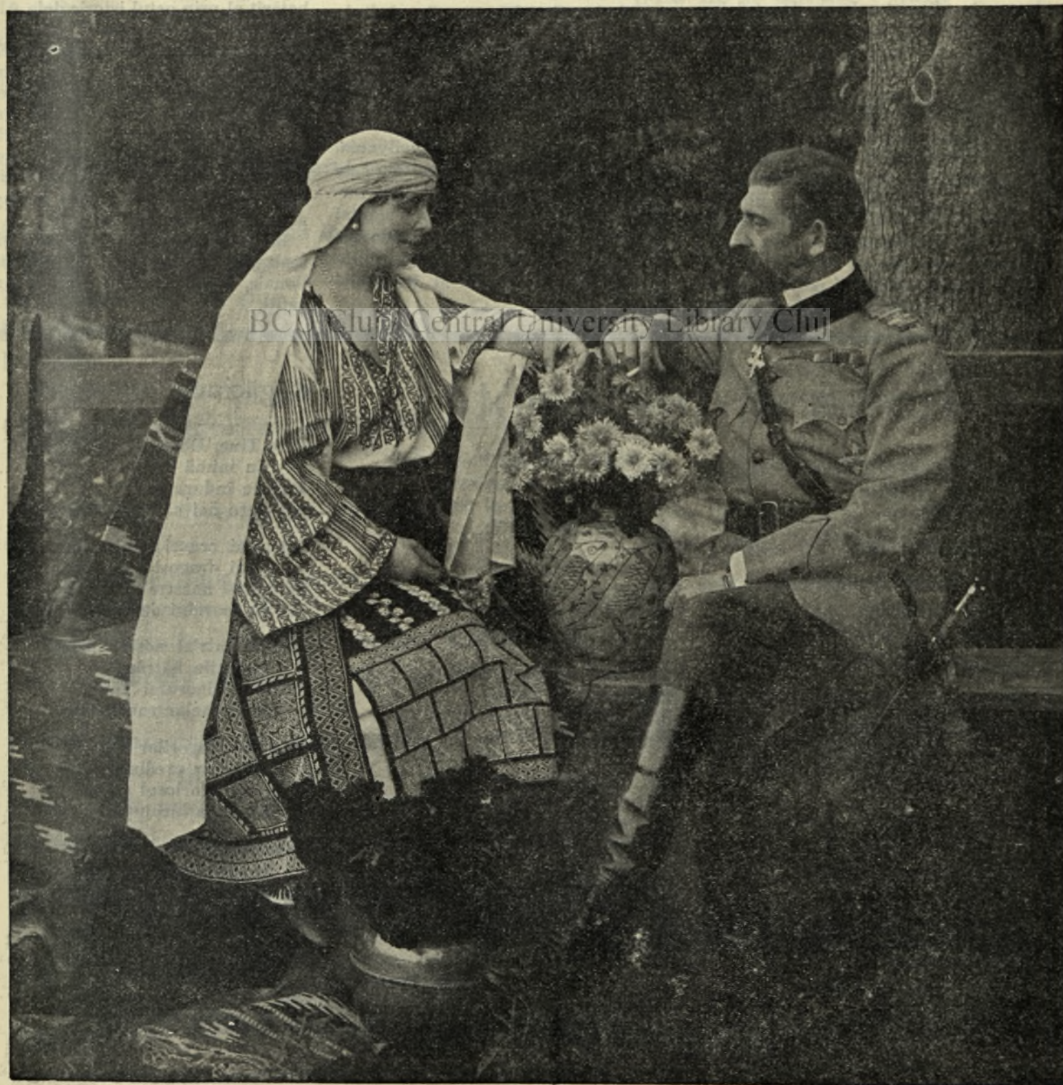
REGELE FERDINAND ȘI REGINA MARIA LA BICAZ IN ANUL 1917.

Redacția și Administrația BUCUREȘTI I Strada Edgar Quinet Nr. 6