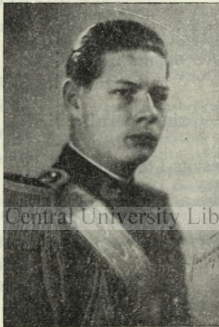
Majestatea Sa Regele Mihai I

La vârsta de 11 ani intră în clasa întâia de liceu. Pregătirea școlară și-o dobândește în mijlocul unei echipe de colegi aleși din toate regiunile țării și din toate straturile sociale. Acest fapt are o puternică semnificație. M. S. Regele Mihai își trăiește întreaga adolescență cunoscând și învățând din marea realitate a Patriei. Camarazii Săi de obârșie fe-