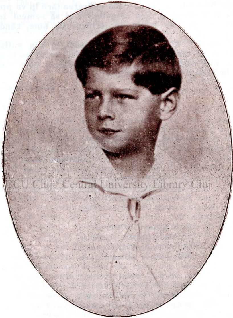
M. S. REGELE MIHAI I.