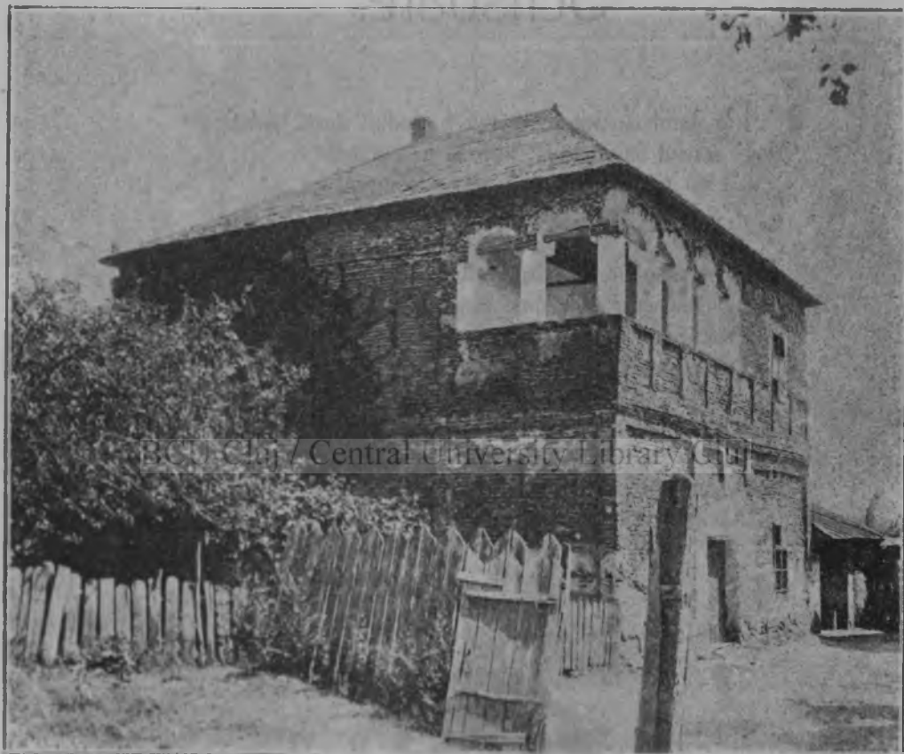
Cula lui Tudor Vladimirescu de pe Cârđanul Cerneșu-Mehedinșu