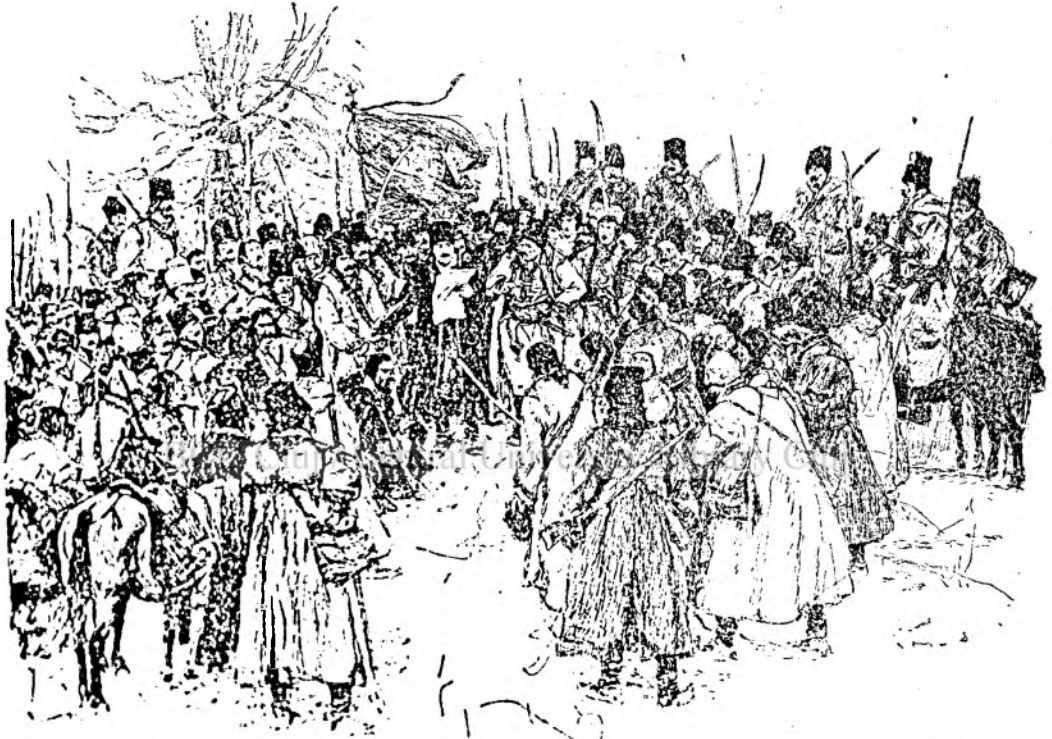
Tudor Vladimirescu este Adunării pandurilor de pe câmpia Padeseului-Mehedinji, cea dintâi imagine a revoluției din 1921