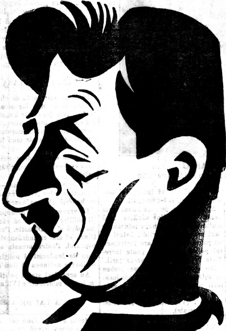
D. I. MIHALACHE

Roma, 6 (Radior). — Hidroavionul „Juncker” cu trei motoare, pilotat de către căpitanul Pasquali a efectuat parcursul Venetia-Roma în patru ore, cu toate că condițiunile atmosferice nu erau tocmai prietene. Acest prim raid ste cea dintâi încercare pe linia aeriană trans-adriatică Roma-Veneta. Pe bordul hidroavionului se aflau 11 călători cu bagajele lor. Căpitanul Pasquali a declarat că în bune condițiuni atmosferice, acest sorz ar putea efectua în mai puțin de trei ore.