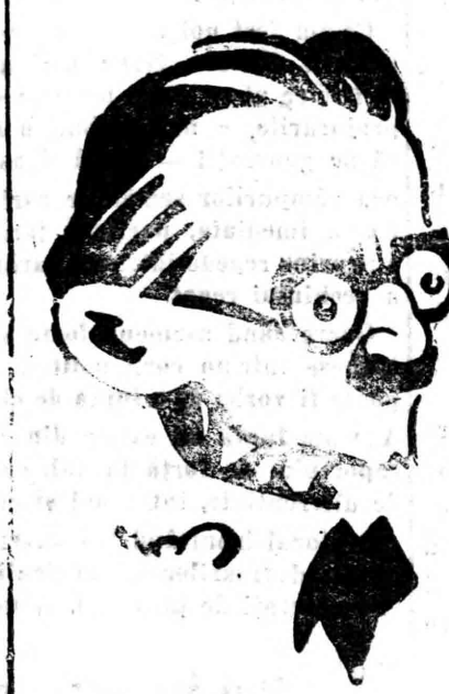
D-L GR. IUNIAN

Transilvaniei”. Între aclamățiunile multor cetățeni la adresa vechiului organ de publicitate și la adresa frunțașilor partidului național-țărănesc.